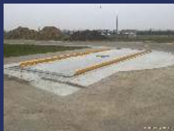
Silniční mostové váhy