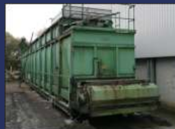
Váhy pro síla